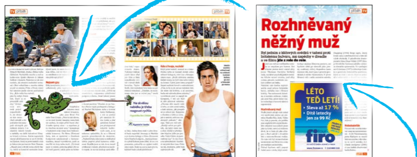
Atypická inzerce na míru