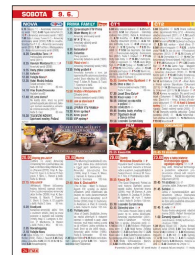
okénko v TV programu