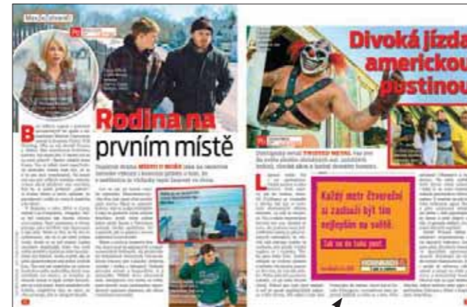
Atypická inzerce na míru v redakční části