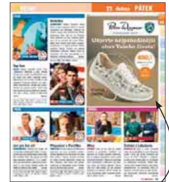
Inzerce v programu