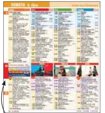
Okénko v TV programu