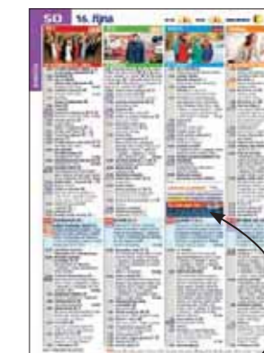
okénko v TV programu