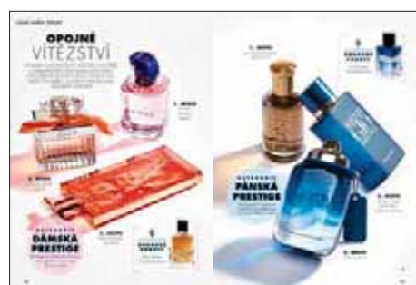
Již po šestnácté jsme vyhláškali Vůně roku.

Zdroj: MEDIA PROJEKT, Unie vydavatelů – ASMEA, STEM/MARK – Median, 2023, Q4 – 2024, Q3