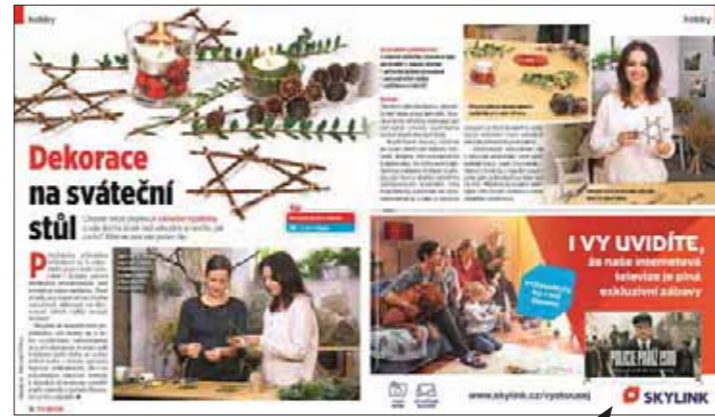
Inzerce v redakční části