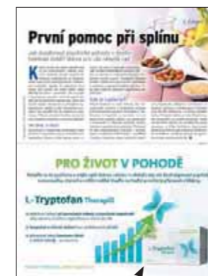
Inzerce v redakční části

Pravidelné rubriky Rozhovory, Výročí slavných, Zdraví