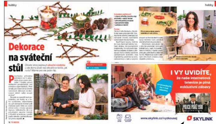
Inzerce v redakční části

Zdroj: MEDIA PROJEKT, Unie vydavatelů – ASMEA, STEM/MARK – Median, 2022, Q4 – 2023, Q3