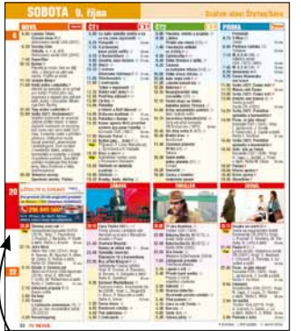
Okénko v TV programu