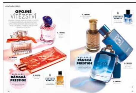
Již po čtrnácté jsme vyhláškali Vůně roku.

Zdroj: MEDIA PROJEKT 4. čtvrtletí 2021 – 3. čtvrtletí 2022