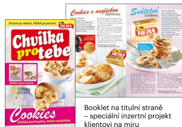
Booklet na titulní straně – speciální inzertní projekt klientovi na míru