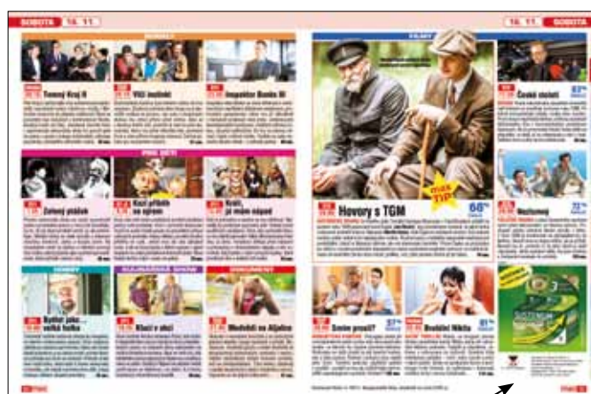
Inzerce v redakční části