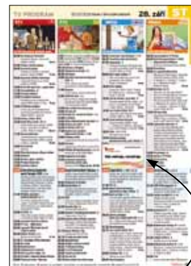
okénko v TV programu