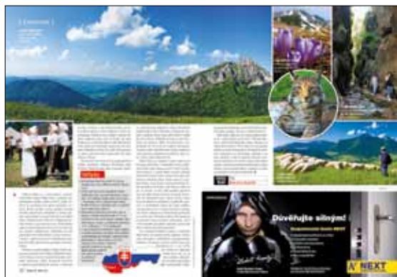
Inzerce v redakční části