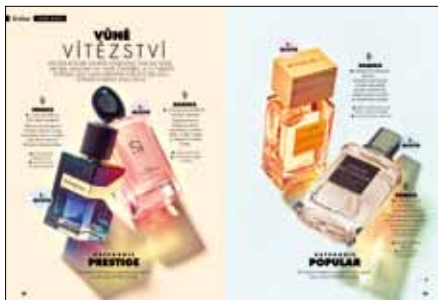
Již po jedenácté jsme vyhláškovali Vůně roku.

Zdroj: ABC ČR 1-6/2019, MEDIA PROJEKT 1. + 2. čtvrtletí 2019