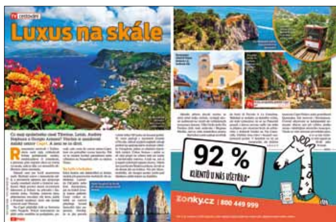
Atypická inzerce na míru